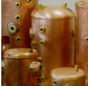
caldaie per macchine da caffè e generatori di vapore

espresso, agli erogatori di bevande e agli idrotermosanitari, in particolare box doccia e bagno turco.